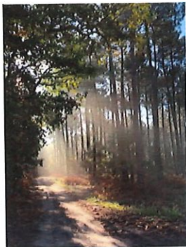
Delaunay Florence, Petit matin en forêt